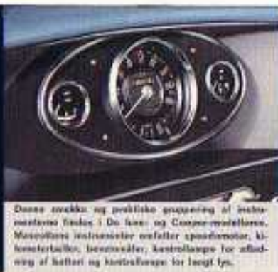
Denne smukke og praktiske gruppering af instrumenterne findes i De lille og Cooper-modellerne. Maccottens instrumenter omfatter speedometer, kilometermåler, benzindæker, kontrollys for afbending af batteri og kontrollys for langt lys.

Automatisk transmission. Et pragtfuldt gearstift, der giver en lufsløsen kombination af manuel og automatisk stift til alle fire gear. Trød på speederen og køn - De glider af sted som i den største limusine - selv bussen og trafikken ... og De kan, når De har lyst, lydeligt gå over til manuel gearbetjening. - den ideelle kombination til bykørsel og lette sporty kørsel på landevejene.