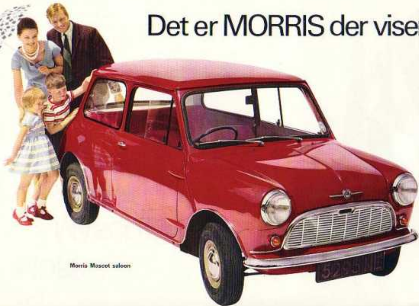
Morris Mascot saloon