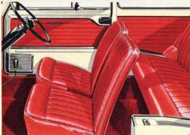
Bredt, anatomisk rigtigt udformede sæder, store vinduer, der giver et godt udsyn, og store døre. De lille og Cooper-modellen har tapper på parkere, elektriske spærrelåser på dørene og udklæbte vof bagved.

ny bil, en moderne bil, fremtidens familievogn i modern design. Kompakt ydre, men med masser af plads indvendig til 4 personer med lange ben og brøde skuldre samt kufferter og en mængde pakker. Og økonomien? - Op til 22 km på literen! I benzin, olie, dæk og service koster det ikke mere end 12 øre pr. km at køre Maccot. Det er 3 øre pr. person! Kig på den og prøv den. Det er lige noget for Dem!