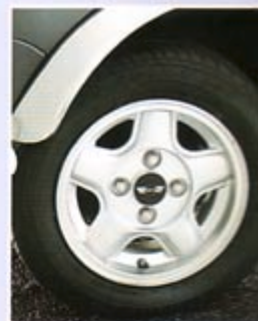
5-SPEICHEN-FELGE ,REVOLUTION' NABENKAPPE