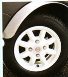
„MINILITE“-FELGE, WEISS RRC10339NMN NABENKAPPE „MINI COOPER“ DTC100690MNH