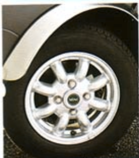
„MINILITE“-FELGE, SILBER RRC10339MNH NABENKAPPE „MINI“ DTC100680MNH