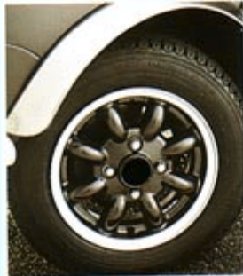
„MINILITE“-FELGE, ANTHRAZIT RRC10339RJP NABENKAPPE, SCHWARZ NAM9105PMD