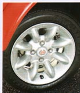
8-SPEICHEN-FELGE (6J x 13) NABENKAPPE ,MINI Cooper'